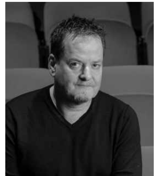
Nicolas Rossier - adaptation et mise en scène de Une Rose et un balai