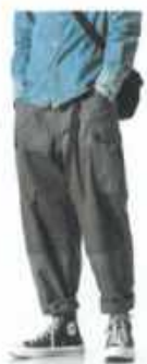
100 Loose Fit Trousers Short irwal AZP021