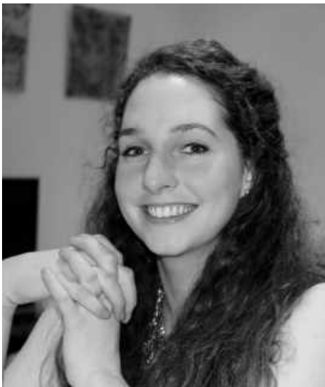
Cécile Revaz - Costumes