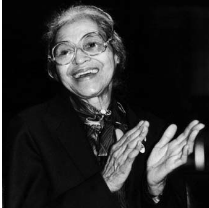
Rosa Louise McCauley Parks (Tuskegee 4.02.1913 – Detroit 24.10.2005) Américaine

Couturière, elle devint la figure emblématique de la lutte contre la ségrégation raciale aux Etats-Unis, ce qui lui valut le surnom de mère du mouvement des droits civiques de la part du Congrès. Elle est devenue célèbre le 1.12.1955 à Montgomery (Alabama) en ne cédant pas sa place à un Blanc dans un bus. Condamnée à payer 10 $ d'amende, elle fait appel. Elle sera défendue par un inconnu de 26 ans, Martin Luther King... A son décès, les 1 ères places des bus à Montgomery restent vacantes et il y a ce mot sur les sièges : La société des bus rend hommage à la femme qui s'est tenue debout en restant assise.