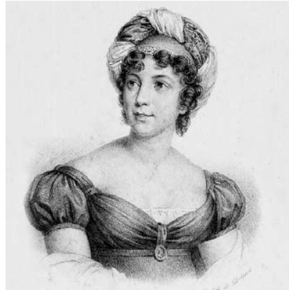
Germaine Necker, baronne de Staël-Holstein , fille du banquier genevois Jacques Necker, ministre des finances de Louis XVI (Paris 22.04.1766 - Paris 14.07.1817) Suisse

Epicurienne, elle savait l'italien et l'espagnol et était versée en science. Enfant prodige au luth, elle apprit aussi le clavier, citait Montaigne dans le texte et tous ses classiques, était promenée de salon en salon par sa mère, où elle y faisait sensation. Femme d'esprit, elle collectionna une ribambelle d'amants, devint une courtisane admirée qu'on surnomma « Notre Dame des Amours ». Elle tenait salon tous les jours, ses célèbres cinq à neuf . Proche de Molière, à sa demande, elle corrigea la première version du Tartuffe . Ninon de Lenclos était le symbole de la femme cultivée et indépendante.