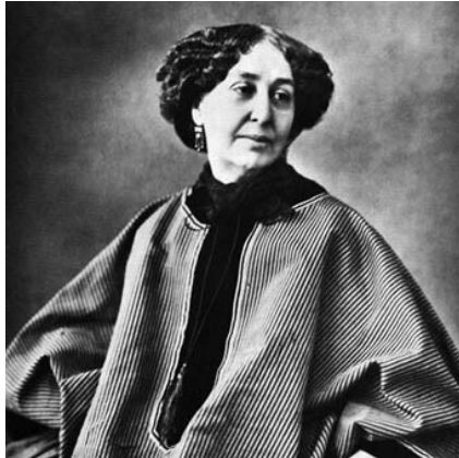
George Sand , pseudonyme d'Amantine, Aurore, Lucile Dupin, baronne Dudevant (Paris, 1.07.1804 – Nohant 8.06.1876) Française

Elle a écrit des romans, des nouvelles, des contes, des pièces de théâtre, une autobiographie, des critiques littéraires, des textes politiques. Elle a fait scandale par sa vie amoureuse agitée (Musset et Chopin sont ses passions les plus célèbres), par son pseudonyme d'homme et par sa tenue vestimentaire masculine dont elle a lancé la mode. Outre son immense production littéraire, elle s'est illustrée par un engagement politique actif à partir de 1848. Engagée pour la «réhabilitation de la femme», ses romans s'ouvrirent à la révolte sociale en faveur des ouvriers et des pauvres.