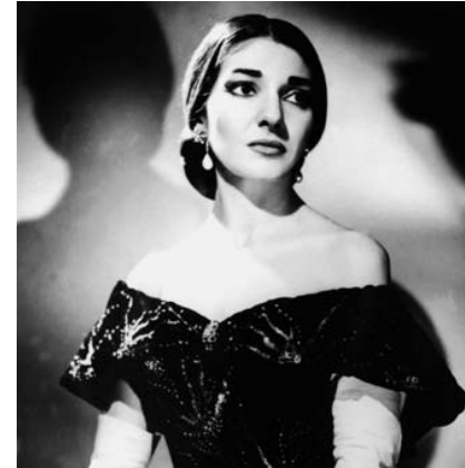
Sophie, Cécilia Kalos, dite La Callas (New-York 2.12.1923 – Paris 16.09.1977) Grecque

Connue pour ses travaux sur l'activité politique, le totalitarisme et la modernité. Ses ouvrages sur le phénomène totalitaire sont étudiés dans le monde entier et sa pensée politique et philosophique occupe une place importante dans la réflexion contemporaine. Etant juive, elle se réfugie aux Etats Unis dès 1941, fuyant l'Allemagne nazie. En 1963, elle couvre à Jérusalem le procès du nazi Eichmann. Ses articles sur la « banalité du mal » déchaîneront la polémique. Conférencière et professeure invitée dans toutes les universités, elle sera nommée titulaire de la chaire de science politique à Chicago.