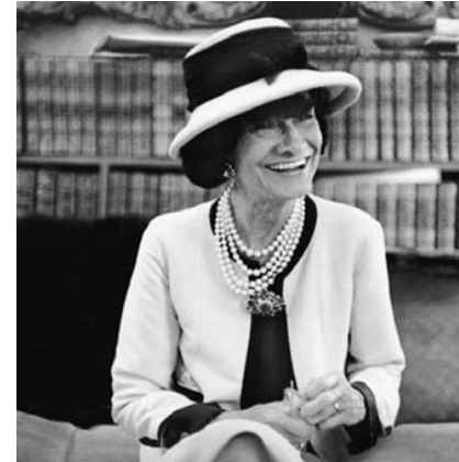
Gabrielle Chanel , dite Coco Chanel (Saumur 19.08.1883 – Paris 10.01.1971) Française

Dès sa petite enfance, elle excelle dans toutes ses études. Après l'insurrection polonaise de 1863 contre les Russes, l'accès à l'université est interdit aux femmes. Marie rejoint alors l'Université Volante, interdite, puis se réfugie en France en 1891. En 1903, elle obtient le prix Nobel de physique avec son mari Pierre Curie et Henri Becquerel, pour ses travaux sur la radioactivité. En 1911, elle obtient son second Nobel, cette fois-ci en chimie, pour ses travaux sur le polonium et le radium. Son exposition permanente aux éléments radioactifs lui donne la leucémie, dont elle meurt.