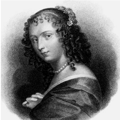
Ninon de Lenclos (Paris 10. 11. 1620 - 17.10. 1705) Française

Epicurienne, elle savait l'italien et l'espagnol et était versée en science. Enfant prodige au luth, elle apprit aussi le clavier, citait Montaigne dans le texte et tous ses classiques, était promenée de salon en salon par sa mère, où elle y faisait sensation. Femme d'esprit, elle collectionna une ribambelle d'amants, devint une courtisane admirée qu'on surnomma « Notre Dame des Amours ». Elle tenait salon tous les jours, ses célèbres cinq à neuf . Proche de Molière, à sa demande, elle corrigea la première version du Tartuffe . Ninon de Lenclos était le symbole de la femme cultivée et indépendante.