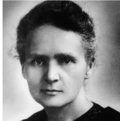
Marie Curie , née Maria Skłodowska (Varsovie, 7.11.1867 – Sancellemoz 4.07.1934) Polonaise

Elle a écrit des romans, des nouvelles, des contes, des pièces de théâtre, une autobiographie, des critiques littéraires, des textes politiques. Elle a fait scandale par sa vie amoureuse agitée (Musset et Chopin sont ses passions les plus célèbres), par son pseudonyme d'homme et par sa tenue vestimentaire masculine dont elle a lancé la mode. Outre son immense production littéraire, elle s'est illustrée par un engagement politique actif à partir de 1848. Engagée pour la «réhabilitation de la femme», ses romans s'ouvrirent à la révolte sociale en faveur des ouvriers et des pauvres.