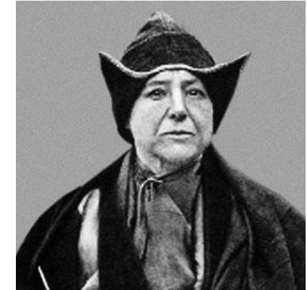
Alexandra David-Néel (Saint-Mandé 24.10.1868 – Digne 8.09.1969) Belge

Sa mère morte, abandonnée par son père, elle se retrouve, à 15 ans, à l'orphelinat. Elle y apprend le métier de couturière. A 24 ans, on la retrouve dans un spectacle de music-hall, les officiers présents la surnomment «Coco». En 1910, son premier amour lui prête les fonds nécessaires à l'achat de son premier salon de modiste. Dès lors, les succès s'enchaînent, à force de travail acharné. Dès 1918, elle met en place ce qui deviendra une des maisons de couture les plus réputées du XX e siècle, employant jusqu'à 4000 ouvrières. Elle est enterrée au cimetière de Bois-de-Vaux à Lausanne en Suisse.