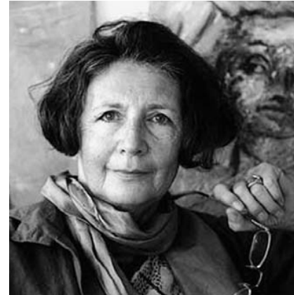
Alice Miller (Pologne 12.12.1923 - St Rémy de Provence 14.04.2010) Suisse

Une des grandes figures littéraire de la période pré-romantique. Dans ces années révolutionnaires, elle se consacra avec passion à la politique et tentera toute sa vie de faire triompher la démocratie. Son œuvre de philosophie politique lui vaudra une grande célébrité. Elle parcourra l'Europe et la décrira en tous sens. Elle est célèbre pour sa lutte contre Napoléon, qui l'exilera à Coppet, près de Genève, où elle recevra les esprits les plus éclairés d'Europe. Sa liaison avec Benjamin Constant, longue et orageuse, est l'une des plus surprenantes que nous ait laissée l'histoire du monde littéraire.