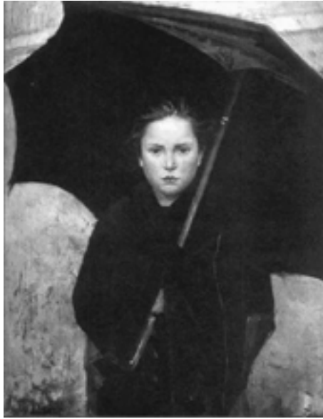
Marie Bashkirtseff, Le parapluie, 1882

“Ça me semble que tout le monde doit m'aimer et je m'épanouis. Vous, venez, arrivez, entrez, regardez-moi : je suis charmante si ce n'est par amour, c'est amitié ou sympathie mais je n'admets pas l'indifférence devant mes vingt-trois ans qui ouvrent les bras à l'univers.”