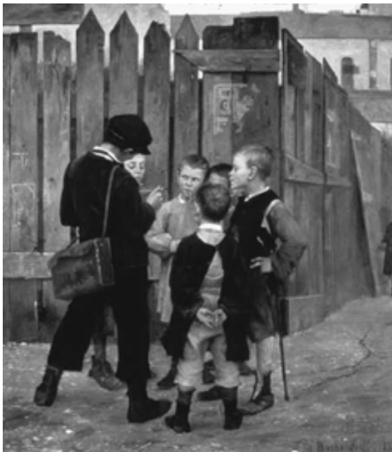
Marie Bashkirtseff, Le meeting, 1884

“Je déteste en tout le juste milieu. Il me faut ou une vie... bruyante ! ou le calme absolu”