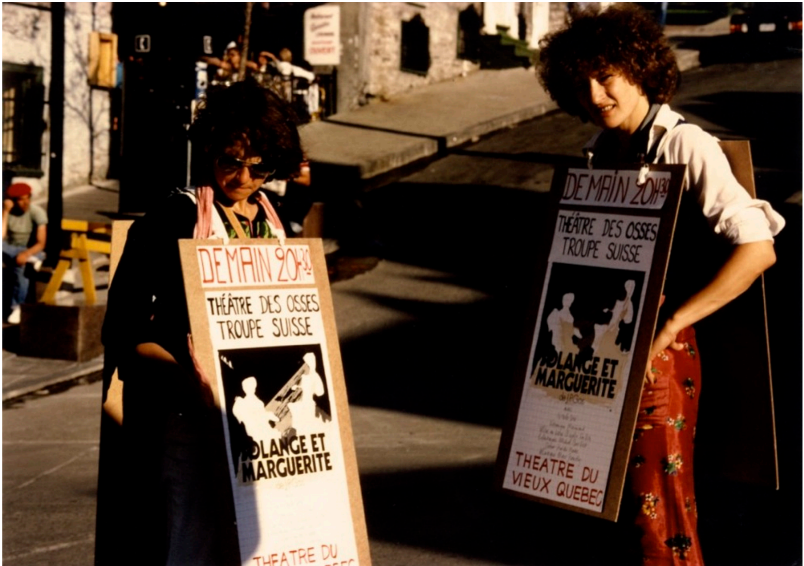
mardi, 2 novembre 2010